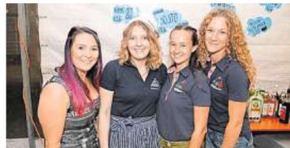
Es wurde unter anderem in der Bierhausdisco ordentlich gefeiert