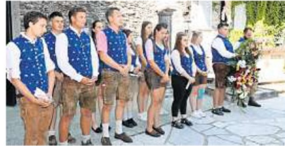
Die Dorfjugend Ossiach bei der Kranzniederlegung am Sonntag