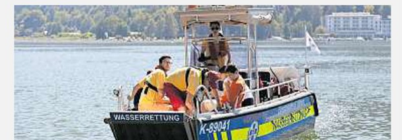
Die Wasserrettung Kärnten war am Ossiacher See unterwegs

Feuerwehren Treffen und Sattendorf sowie Wasserrettung trafen sich in Treffen und Annenheim, um ein Großschadensereignis zu proben – inklusive Rettung einer untergegangenen Person.