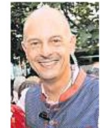
Presslinger war 15 Jahre Organisator